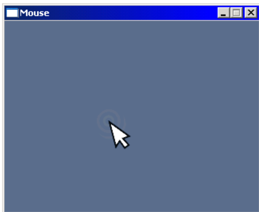
Funcionando sobre Windows XP con el tema de escritorio clásico

si ejecutamos este mismo programa en un sistema Windows notaremos que su funcionalidad es idéntica: